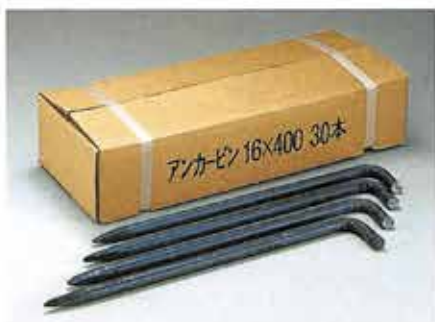
アンカーピン 16×400 (30本入)