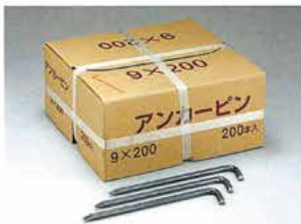
アンカーピン 9×200 (200本入)