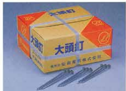
大頭釘 5×150 (NET12Kg/500本入)

日本工業規格表示認証工場 ひし形金網 JIS G 3552 認証番号 JQ 0408033